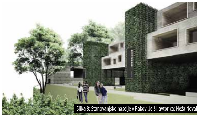
Slika 8: Stanovanjsko naselje v Rakovi Jelši, avtorica: Neža Novak.

skih enot. Te so izdelane iz lesene konstrukcije po sistemu predizdelanih enot, ki se jih naknadno pripelje in montira na gradbišču. Posamezni stanovanjski volumen je izdelan kot visok lesen palični nosilec, ki brez vmesnih podpor, kot most, premošča razdaljo med enim in drugim komunikacijskim jedrom. Na ta način se po mnenju avtorice skrajša čas gradnje, hkrati pa je omogočena višja kakovost končnega izdelka.