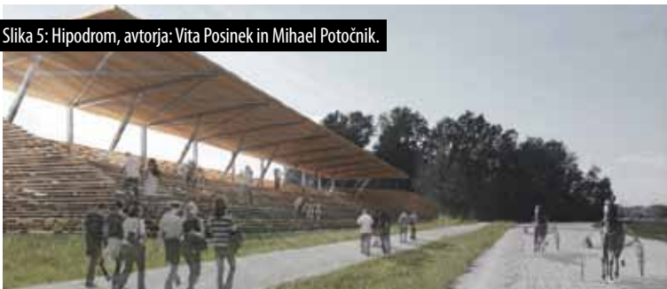
Slika 5: Hipodrom, avtorja: Vita Posinek in Mihael Potočnik.

V zadnji sklop študentskih nalog so sodili projekti, ki so na danih lokacijah skušali oblikovati več stanovanjskih naselij. Enotno vodilo vseh projektov je bilo, kako zasnovati sodobne stanovanjske tipologije, s katerimi bi bolj racionalno izkoristili površino posameznih parcel. Študenti so izdelali več predlogov stanovanjskih naselij, ki kljub strnji strukturi ohranjajo merilo in značaj obstoječega naselja.