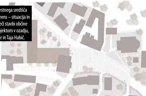
Slika 2: Ureditev mestnega središča Križevcev pri Ljutomeru – situacija in pogled proti obstoječi stavbi občine z večnamenskim objektom v ozadju, avtorja: Rok Hočevar in Taja Habič.

Iz podobnega gradbenega materiala je izdelana tudi druga naloga, ki prostor ob obstoječi občinski stavbi obravnava na povsem drugačen način. V nasprotju s prej opisano nalogo, kjer je bilo predlagano, da se trg zapre v liniji obstoječe stavbe, sta študenta Rok Hočevar in Taja Habič osnovni volumen večnamenskega objekta postavila na skrajni severozahodni del lokacije tako, da ta pred vhodom oblikuje nov manjši trg, ki je preko ožine ob stavbi obstoječe občine povezan z osrednjim krajevnim trgom (slika 2). Na ta način obstoječa stavba občine ohranja svojo dominantno lokacijo, novogradnja večnamenskega objekta pa je postavljena v ozadje.