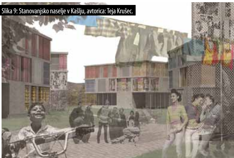
Slika 9: Stanovanjsko naselje v Kašlju, avtorica: Teja Krušec.

Druga naloga, ki jo je izdelala študentka Teja Krušec, večstanovanjsko stavbo razume kot prazen okvir, ki prebivalcem omogoča najosnovnejše servise, kot na primer kuhinjo in stranišče (slika 9). Na ta način avtorica postavi prazen lesen skelet s komunikacijskim in sanitarnim jedrom. Ves preostali prostor je prazen in ga lahko prebivalci postopoma, glede na finančne zmožnosti, dograjujejo sami. Pri izbiri materialov avtorica raziskuje možnost ponovne uporabe izdelkov množične potrošnje in odpadnega materiala.