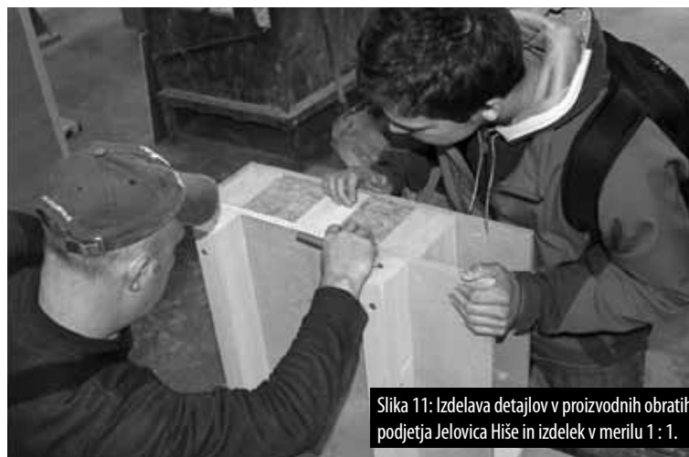
Slika 11: Izdelava detajlov v proizvodnih obratih podjetja Jelovica Hiše in izdelek v merilu 1 : 1.