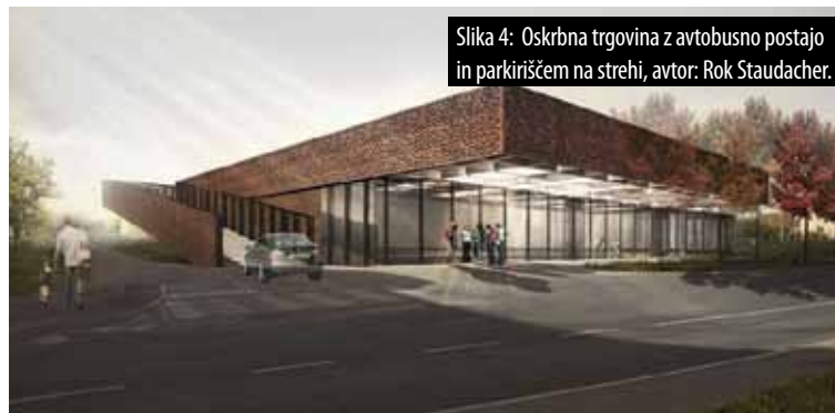
Slika 4: Oskrba trgovina z avtobusno postajo in parkiriščem na strehi, avtor: Rok Staudacher.

izmed najbolj perečih problemov Križevcev pri Ljutomeru je lokacija enotne avtobusne postaje, saj ima kraj trenutno tri manjše avtobusne postaje na treh različnih lokacijah. Glede na smeri obstoječih magistralnih cest se zdi lokacija na mestu obstoječe oskrbne trgovine najbolj smiselna. Problem, ki ga je moral rešiti avtor naloge, je bil, kako na prostorsko omejeni parceli zasnovati novo trgovino s parkiriščem in tudi novo avtobusno postajo s postajališčem za vsaj dva avtobusa. Problem je rešil tako, da je prednjo fasado trgovine zasnoval kot postajališče za avtobuse z velikim konzolnim nadstreškom, parkirišče za potrebe trgovine pa je organiziral na strehi stavbe (slika 4).